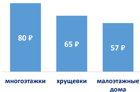
Средневзв. цена 1 м2 по типам домов, тыс. руб.